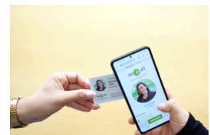
Nr. 4: Video zum Scanvorgang der NFC-vCard