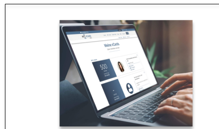
Abbildung 1: Startseite des individuellen URL Portal nach dem Einloggen